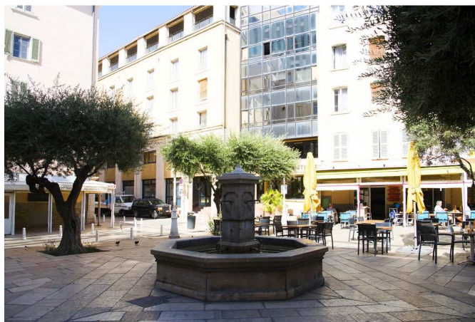
La Résidence Services Bastide Bonnetières est située dans un quartier dynamique au cœur de Toulon.

« Je me réjouis des perspectives de collaboration avec les équipes de Medeos dans les semaines et mois à venir. Cette nouvelle acquisition d'un groupe régional à la philosophie familiale, nous permet de compléter notre offre pour proposer un parcours d'accueil et de soins globale et de conforter notre position de leader dans le Sud avec un total désormais de 67 résidences médicalisées et 19 résidences seniors haut de gamme, 12 agences de services et de soins à domicile, pour le bien-être des personnes âgées et de leurs proches. »